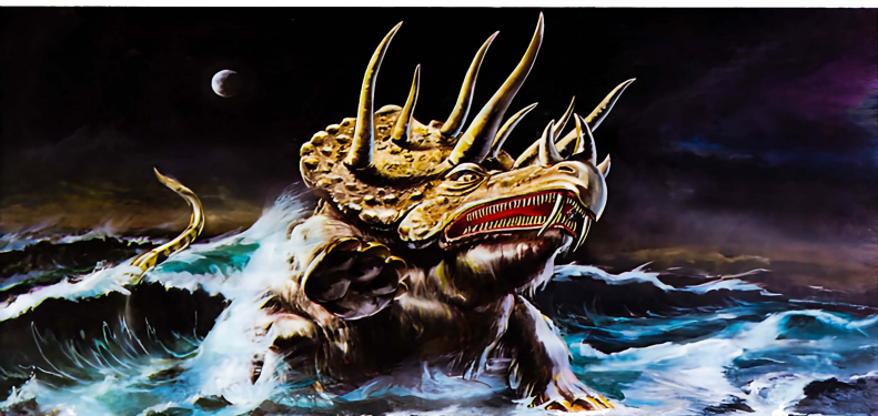
Dem dritten Tier aus Daniels Traum folgte ein viertes, das „furchtbar und schrecklich“ war (Dan. 7).

ihm Macht gegeben, Geist zu verleihen dem Bild des Tieres, damit das Bild des Tieres reden und machen könne, daß alle, die das Bild des Tieres nicht anbeteten, getötet würden. Und es macht, daß sie allesamt, die Kleinen und Großen, die Reichen und Armen, die Freien und Sklaven, sich ein Zeichen machen an ihre rechte Hand oder an ihre Stirn, und daß niemand kaufen oder verkaufen [allgemein: einen Beruf ausüben] kann, wenn er nicht das Zeichen hat, nämlich den Namen des Tieres oder die Zahl seines Namens“ (Offb. 13, 14 - 17).