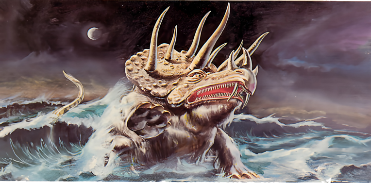
DET TREDJE DYRET i Daniels drøm ble fulgt av et fjerde som var «fryktelig og forferdelig» (Dan. 7).